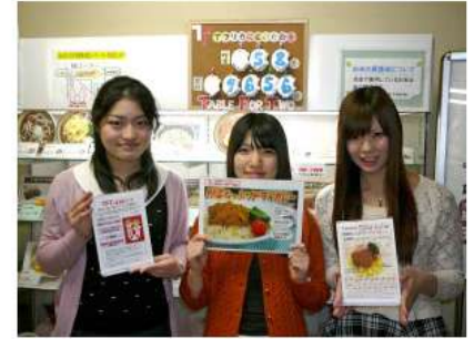
献立を独自に作っているお茶の水女子大の公認サークル「Ochas」の学生たち。女子学生ならではの視点を取り入れたユニークなメニューになっている

Ochasのメニューは累計12種類。人気のメニューは「ねばねば具だくさんそば」や「里芋のとりにき丼」などで、全て一品料理。女性が気になる「美肌」や「冷え」、「疲労回復」などに効果のあるビタミンやミネラル豊富な食材を多く利用するなど工夫している。価格は400円程度で、カロリー(は800キロカロリー前後が多い。