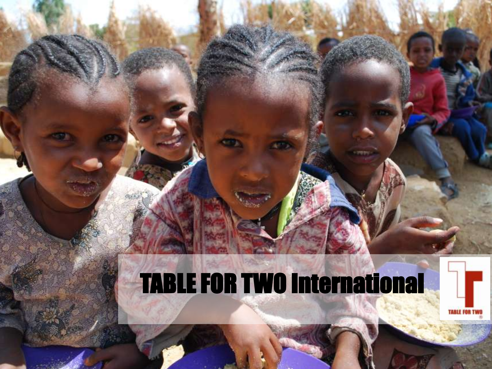
TABLE FOR TWO International